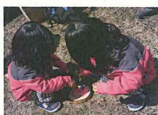
カラフルな絵がかけたね！