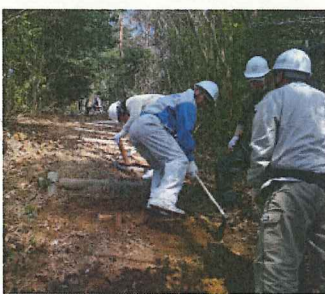
急斜面で足を踏ん張りながら の作業でした！

急斜面下の階段設置の 苦勞を体感。 普段山登りをするときには、 ありがたさはあまり気にと めていなかったです…。