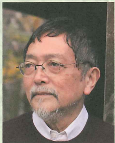
いげざわ なつき 池澤 夏樹 作家、詩人

1945年北海道帯広市に生まれる。小学校からは東京育ち。以後、多くの旅を重ね、3年をギリシャで、10年を沖縄で、5年をフランスで過ごして、今は札幌在住。1987年に『スティル・ライフ』で芥川賞を受賞。その後の作品に『マシアス・ギリの失脚』、『花を運ぶ妹』、『静かな大地』、など。東北大震災に関わる著作に『春を恨んだりはいらない』と『双頭の船』がある。最新作は小説『アトミック・ボックス』。2014年から『池澤夏樹＝個人編集 日本文学全集』を刊行中。